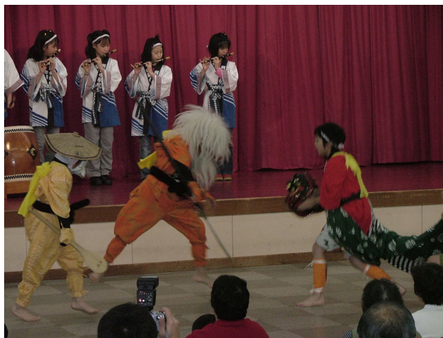
利尻小学校児童による南浜獅子神楽